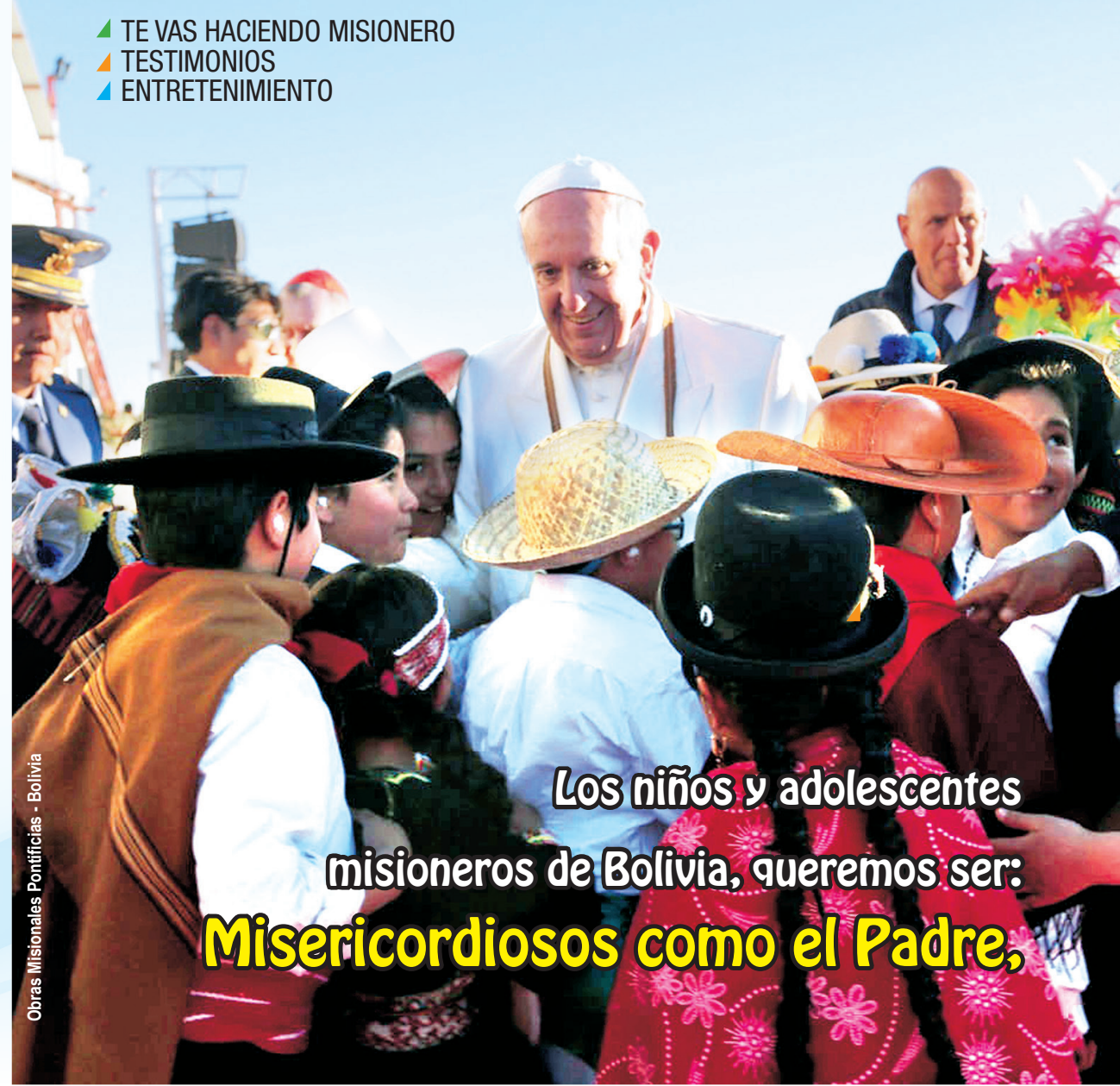
Obras Misionales Pontificias - Bolivia

Los niños y adolescentes misioneros de Bolivia, queremos ser: Misericordiosos como el Padre,