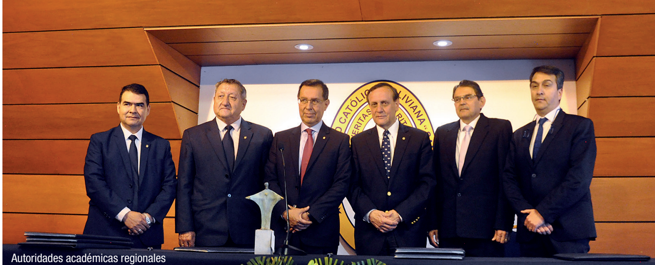
Autoridades académicas regionales