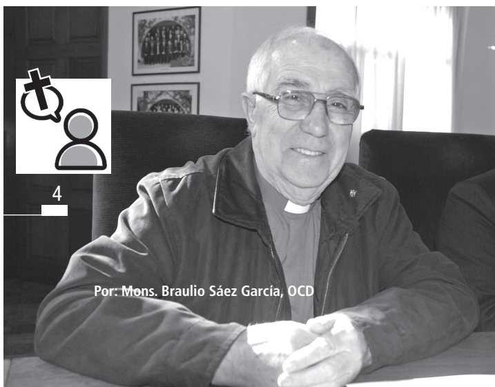
Por: Mons. Braulio Sáez García, OCD

"En muchos casos las familias que visitamos expresaban sorpresa porque los católicos no siempre realizamos esta misión de llevar