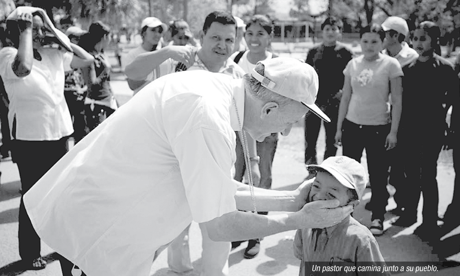
Un pastor que camina junto a su pueblo.