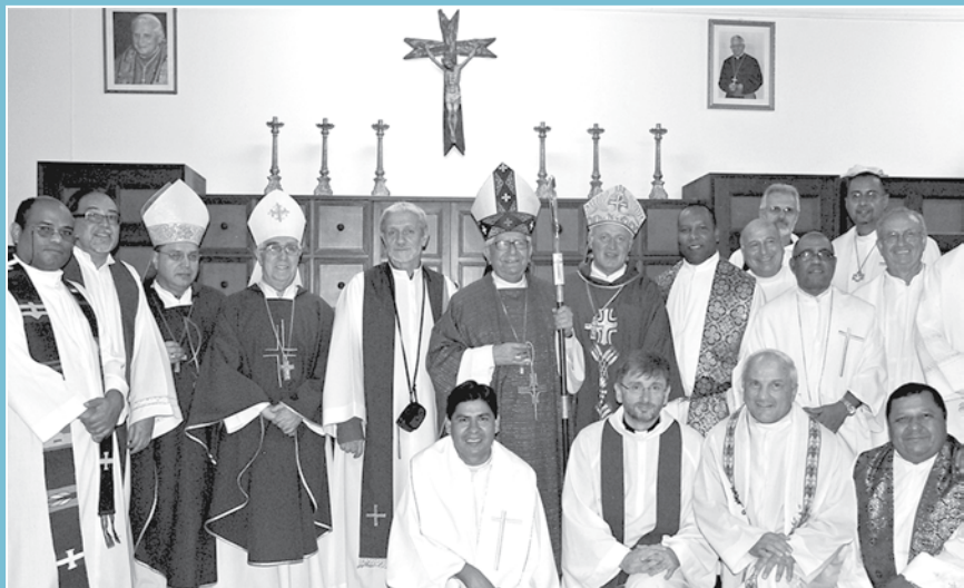
Directores OMP de América, junto al Cardenal Julio Terrazas luego de la Eucaristía en la Basílica Catedral de San Lorenzo, Santa Cruz.

Mención especial merece la celebración eucarística presidida por el Cardenal Julio Terrazas, Arzobispo de Santa Cruz, quien agradeció haber escogido Santa Cruz para reunirse y reflexionar el trabajo misionero. "No hablen mucho, nos dice el Señor, más bien centren sus esfuerzos en los desafíos que nos ofrece el mundo actual, con la misma valentía que lo hicieron sus apóstoles, al inicio de la evangelización... mostrando lo que puede suceder si hacemos su voluntad, mostramos que nos interesa más su Reino que el nuestro, en resumen sintiendo el llamado de Jesús", fue el mensaje que dejó el Cardenal a todos los directores de OMP.