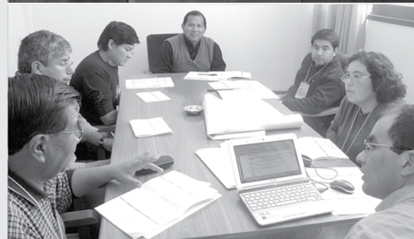
Aporte de los grupos de trabajo