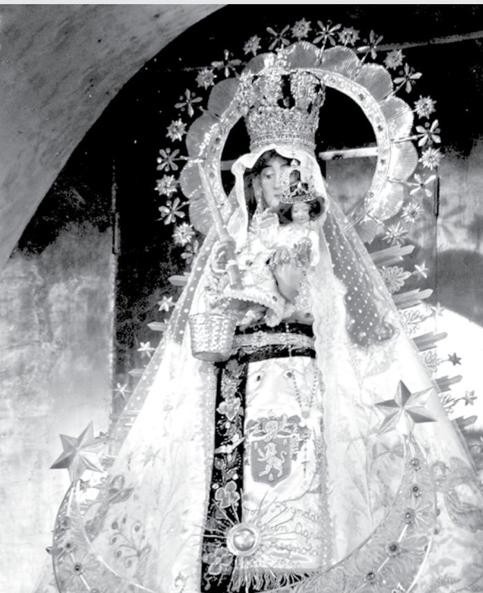
Una réplica de la Imagen de la Virgen de Copacabana acompaña las oraciones en el velatorio del Santuario.

El camino del misionero tiene varios rostros y formas de hacer presente el mensaje salvífico de Dios y sin dudar se puede afirmar que, en Copacabana, la Madre de Dios encontró el mejor instrumento para hacer discípulo misionero a todo aquel, lugareño o visitante, que pone su confianza en la Virgen de la Candelaria, más conocida como la Mamita de Copacabana.