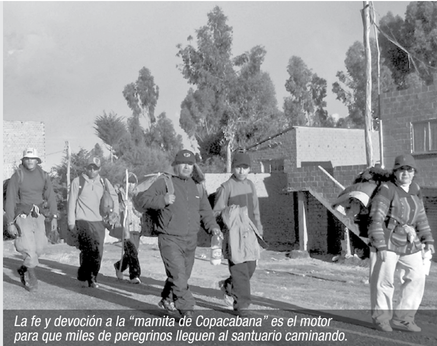
La fe y devoción a la “mamita de Copacabana” es el motor para que miles de peregrinos lleguen al santuario caminando.

Francisco Tito Yupanqui talló dos réplicas más de la Virgen de Copacabana, una de ellas se encuentra en Cocharcas – Perú y la otra imagen que peregrinó por La Paz, Oruro, Potosí, y Sucre se encuentra ahora en Cochabamba, bajo la custodia de los religiosos agustinos.