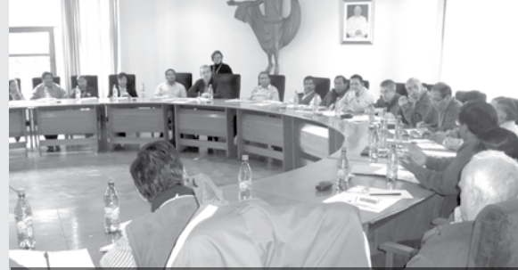
Elaboración del cronograma de actividades 2011.

El último objetivo busca concienciar a las parroquias en procura de economías transparentes, solidarias y participativas. Se trata de cambiar la mentalidad equivocada de que la iglesia tiene plata y no necesita de ayuda a una mentalidad de decir la iglesia es de todos los bautizados y todos tenemos que colaborar en su financiamiento. Claro que primeramente hay que conocer la realidad económica de cada parroquia y construir algunos instrumentos para avanzar en la transparencia de la economía, rendir cuentas a los fieles para crear la conciencia de ayudar al sostenimiento de la iglesia, explicó P. Fuentes.