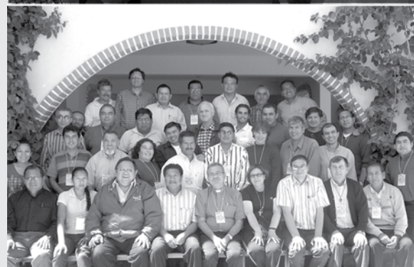
Participantes del II Encuentro de Parroquias.