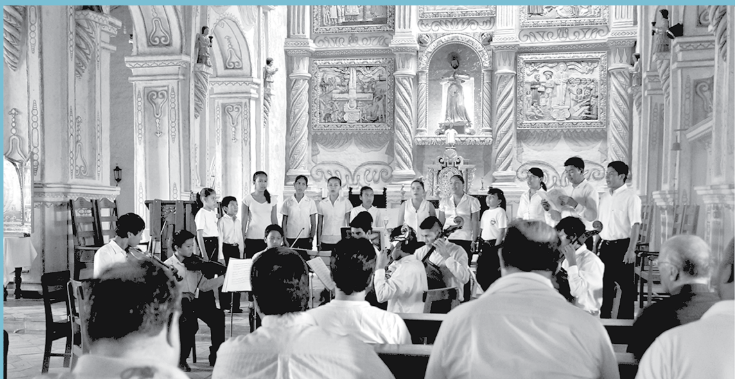
Un concierto magistral de los jóvenes artistas de San Javier sorprendió y quedó grabado en los corazones de los Directores de OMP de América.

El intercambio dejó claro que la formación y el acompañamiento a los grupos de la infancia y adolescencia misionera son las principales actividades que se desarrollan, en muchos casos viajando hasta el último rincón del continente, organizando encuentros locales y nacionales, promoviendo en cada uno de ellos la identidad cristiana católica a través de los sacramentos, la participación activa en las celebraciones eucarísticas, buscando espacios de oración y meditación y, en muchos casos, haciendo uso de medios de comunicación como la radio, la televisión y el internet.