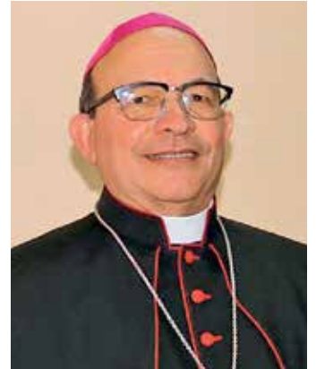
Mons. Carlos Curiel, Obispo de Carora – Venezuela

Nació en una comunidad de Viacha-La Paz, el 5 de mayo de 1963. Recibió la ordenación sacerdotal el 29 de junio de 1992, fue posesionado Obispo Auxiliar de El Alto el 26 de junio de 2019, y Obispo de la Prelatura de Corocoro el 7 de abril de este año.