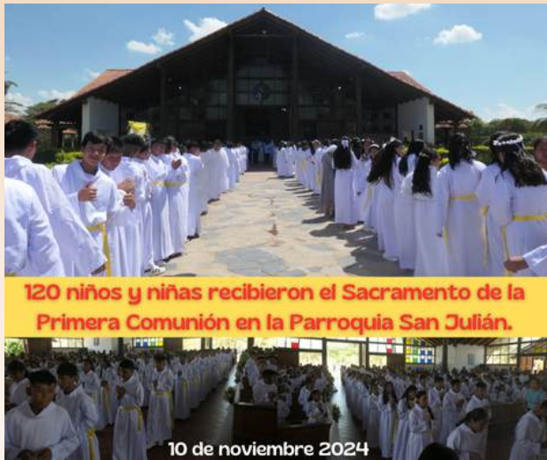
120 niños y niñas recibieron el Sacramento de la Primera Comunión en la Parroquia San Julián.