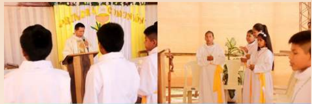
EN EL SALÓN DE LA ZONA NORTE (SAN JULIÁN), EL DOMINGO 10 DE NOVIEMBRE 13 NIÑOS TAMBIÉN RECIBIERON SU PRIMERA COMUNIÓN.